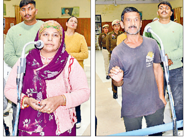
रोहतक। जिला विकास भवन स्थित डीआरडीए सभागार में समस्या रखते फरियादी।