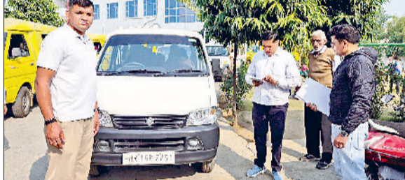
आरटीए विभाग की टीम स्कूल बसों की जांच के लिए पहुंची।