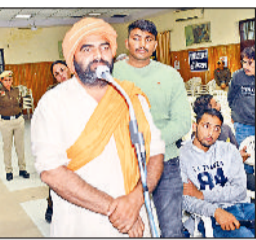
हरिभूमि न्यूज | रोहतक