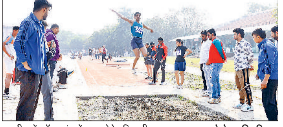
एमडीयू में लॉन्ग जंप में भाग लेते प्रतिभागी।