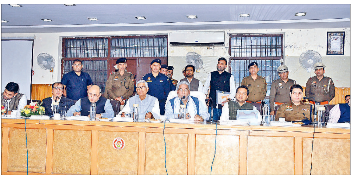
रोहतक। डीआरडीए सभागार में जिला लोक संपर्क एवं परिवेदना समिति की मासिक बैठक में लोगों की समस्याएं सुनते मंत्री कृष्ण लाल पंवार।