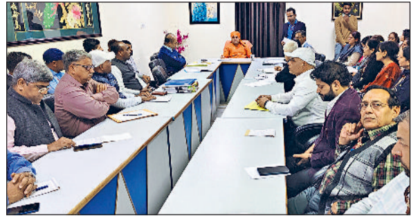
रोहताक। मस्तनाथ विवि के शिक्षण स्टाफ की बैठक की अध्यक्षता करते हुए कुलाधिपति महंत बालकनाथ योगी, बैठक में विभिन्न विभागों के डीन, एचओडी और वरिष्ठ मौजूद रहे।